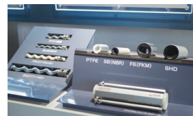
さまざまな形・素材のローターとステーター。ステーターに使われるゴムが食品などに混入しないよう、磁性体を練り込んだゴムを素材から開発し、磁力で除去できるようにした製品もある

当社のモノポンプの技術が用いられている分野は主に3つあります。1つは上下水道やし尿処理などの官公需、民間工場の排水処理など環境の分野。2つ目は食品で、人手不足を補う自動化や衛生管理・安全性への要求がますます厳しくなるなか、部品点数が少なく洗浄しや