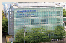
ヘインテクノベルク株式会社