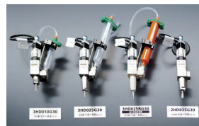
高粘度の液体を1万分の1cc単位で高精度かつ、自在な形状で塗布・充填できる「ヘインシモノディスペンサー HD型」

モノポンプの構造は、ゴム製のステーター（2条雌ねじ）のなかに、金属製のローター（1条雄ねじ）が入っています。ローターが回転すると、ステーターとの間にキャビティーと呼ばれる密閉空間が形成されます。密閉空間は強い吸引力を発生しながら回転とともに次々とつくり出され、吐出口へ移動していきます。つまり、キャビティー内に充満した液体が密閉された空間ごと前へ、前へと連続移動していく仕組みになっており、この構造が難液の移送を可能にするわけです。とくに