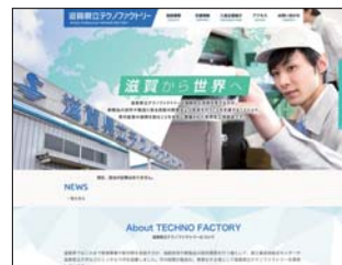
滋賀県立テクノファクトリーサイト

滋賀県立テクノファクトリーのWebサイトでは、「施設情報」「支援情報」「入居企業情報」などの情報を掲載しています。