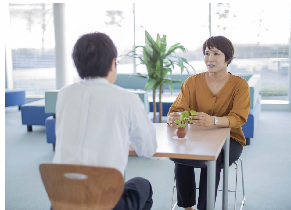
社外カウンセリング

そのような中で不調者を回復に導くことはもちろんですが、不調者が出ないような環境づくりを人事担当者や上司の方へアドバイスしたりコンサルティングするのが私の仕事です。端的に言えば、企業の人事担当者のメンタルヘルス対策の後方支援、復職者の再発予防支援、ストレスチェック調査のフォローアップや研修の企画運営などです。県内外5つの企業と、主に顧問契約