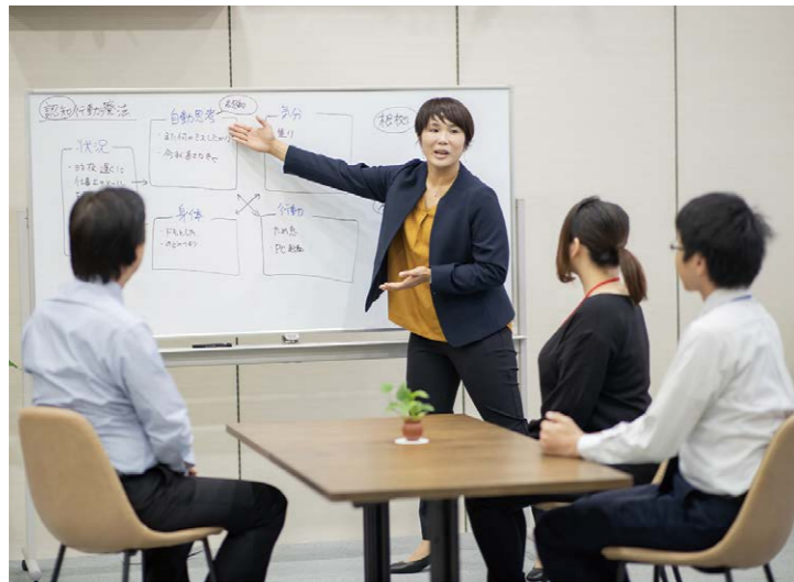
人事担当者へのコンサルテーション