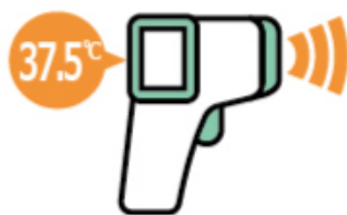
受付時の検温 (体温が37.5度以上ある方は ご出席をご遠慮いただきます)