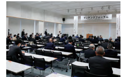
マッチングフォーラム

技術経営、最先端技術、成長分野や産業界の情報提供をメインテーマにすえ、講師を招いての特別講演とネットワーク会員による講演や企業プレゼンテーション等を行います。本フォーラムの開催により新たなビジネス展開や新製品開発につながるニーズとシーズの出会いの場、経営者と研究者等との交流の場を提供し、研究開発や事業化プロジェクトの創出の機会と産学官金連携のネットワーク強化を目指します。