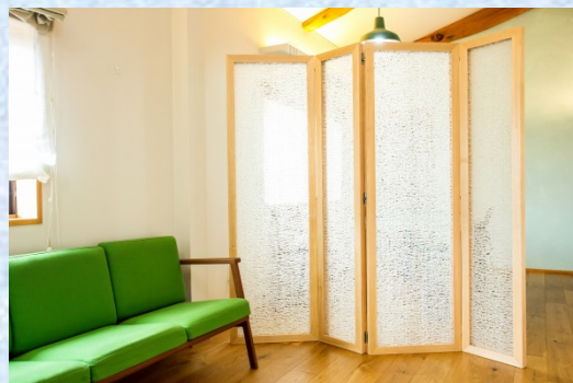
PlaRain®を使用したパーティション