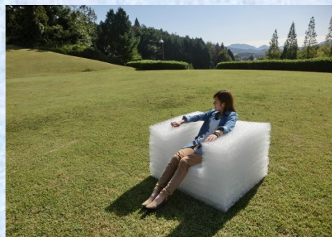
PlaRain®を使用したソファ