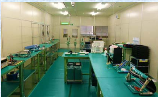
医療機器専用製造ルーム