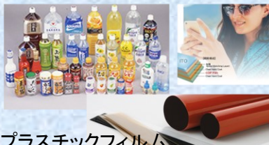
プラスチックフィルム、エンブラ製品など