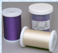
生体吸収性医療材料