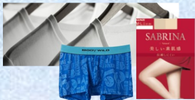
肌着・パンストなど