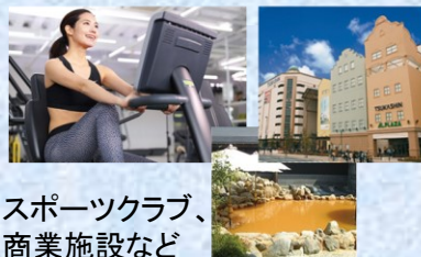
スポーツクラブ、商業施設など