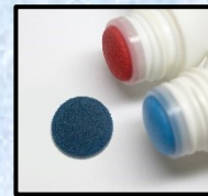
鎮痛剤の塗布用スポンジ