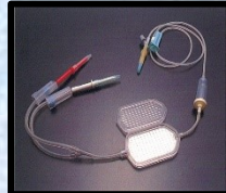
成分輸血のフィルター