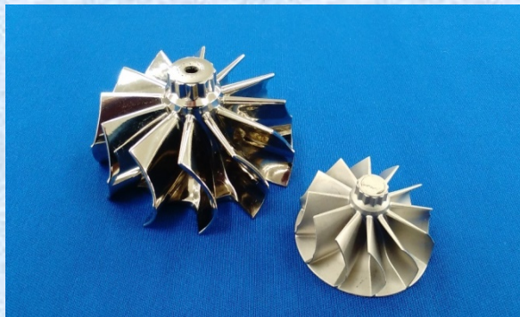
複雑形状の MIM 製品サンプル 材料：SUS,チタン等の高強度、耐熱合金