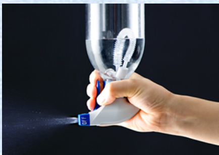
錘付ジャバラチューブ