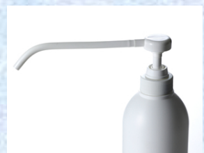
ポンプ用曲げチューブ