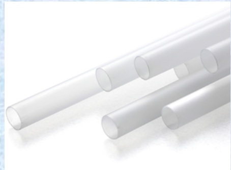
肉薄チューブ(肉厚0.12mm)