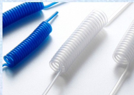
スパイラルチューブ