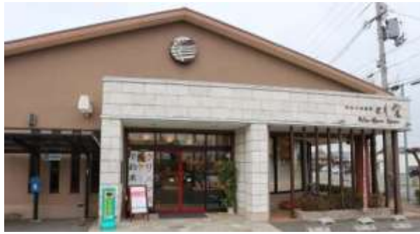
とも栄菓舗 藤樹街道本店