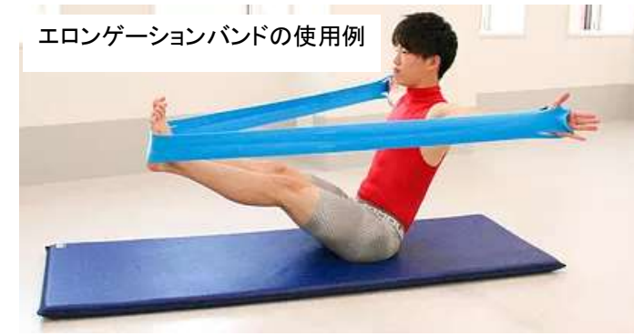
エロンゲーションバンドの使用例

滋賀県は新聞報道で男性の長寿日本一と言われていますが、同社の活躍によりすでに訪れている超高齢化社会において、全国で健康寿命の延伸が期待されます。