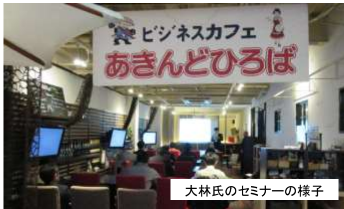
大林氏のセミナーの様子

大林氏は業務システムの要、データベースソフトウェアで世界のトップ企業であるオラクル社の日本法人、日本オラクルで活躍された後、クラウド全盛期となるタイミングに合わせて日本マイクロソフト社へ転籍、世界最高水準のクラウドシステムである「Azure」を取扱いされ、常にIT業界の最先端で活躍しておられます。