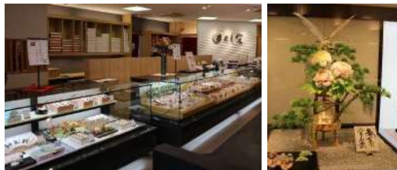
とも栄菓舗の店内（和菓子のショーケースと伝統工芸菓子）

その後の10年間で、安曇川では、様々な業態の大型店が増え、電車や車で京都に容易に行けるようになり、小規模店舗には非常に厳しい状態となった。「このままではじり貧になる、地元のお客さんから愛され繁盛する店になりたい」、という強い思いから1997年に藤樹街道に本店を移転した。商店街時代には無かった広い駐車場を備え、ゆったりとした売り場。自家用から贈答品まで、西近江に因んだ四季折々の和洋菓子を製造販売し、現在は和菓子の輸出にも力を入れている。