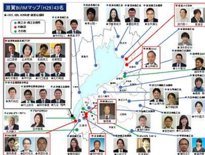
滋賀 IM ネットワークマップ

4ヵ月という限られた研修期間において、当初は長いと感じられた時間も、起業家の現場で真剣に向き合ううちに様々な疑問や課題が湧き、解決できぬまま終了してしまうことも多くあります。今後は滋賀県内43名のIMの一員として引き続き起業家と向き合い高め合う活動